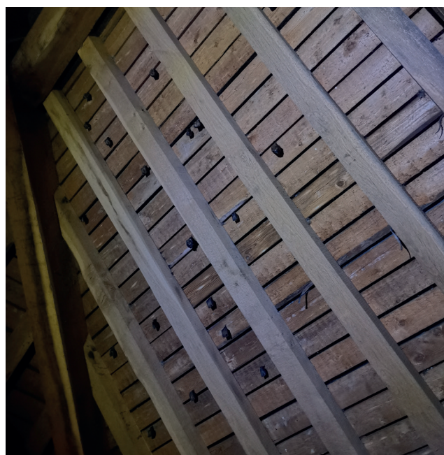
Nurserie de Petits Rhinolophes

Durant près de deux heures, les 25 participants ont pu découvrir le monde fascinant de ces petits mammifères nocturnes, et se familiariser avec les espèces qui fréquentent le territoire. Malgré les conditions météorologiques difficiles, la soirée s'est terminée par une déambulation dans le village à la recherche de ces petites bêtes discrètes mais utiles !