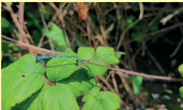
Couple d'Agrions de Mercure

Ces informations permettront à terme d'établir un cahier technique, accessible à toute personne souhaitant réaliser des entretiens de cours d'eau ou fossés dans le respect de la biodiversité.