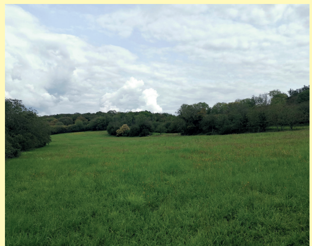
Prairie engagée en Mesure Agro-Environnementale et Climatique

Les campagnes précédentes ont rencontré un grand succès, avec une centaine d'agriculteurs du territoire engagés dans des mesures de réduction de traitements phytosanitaires, de création ou de gestion de prairies, d'entretien de haies, mares, fossés, ou vergers, entre autres. Le nouveau PAEC continue sur cette lancée, avec sur sa première année une soixantaine d'agriculteurs reconduisant des mesures ou s'engageant pour la première fois dans le dispositif.