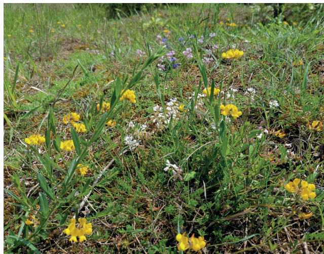
Pelouse fleurie de la butte du Hutrel (78)

Leur mise en œuvre se fait ensuite selon une démarche volontaire et contractuelle, basée sur la signature de contrats, financés par les régions et l'Union Européenne, ou de chartes, afin de mettre en place des actions de gestion et d'encourager le développement de pratiques favorables à la biodiversité.