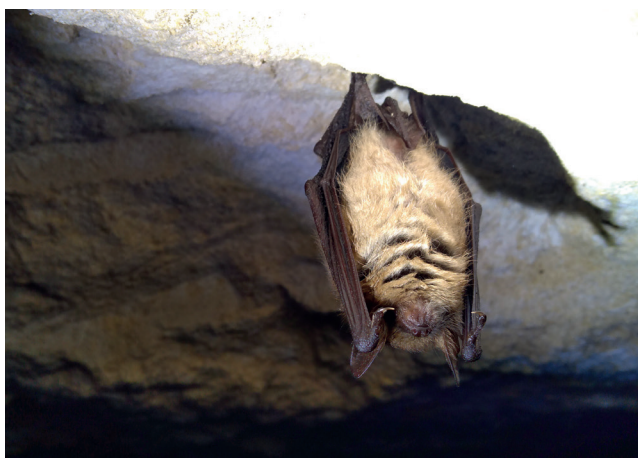
Murin à oreilles échanquées

Louise-Anne a donc établi des cartographies des territoires de chasse potentiels autour de chaque nurserie connue, en évaluant l'intérêt de chaque habitat pour l'espèce concernée. Les résultats de cette étude permettront une meilleure prise en compte des enjeux chiroptères en période estivale dans les sites Natura 2000, et des informations sur les zones à enjeux à protéger dans le cadre de la nouvelle Stratégie de création d'Aires Protégées.