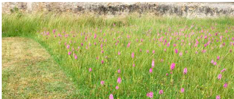
Cimetière de Sagy, un des sites étudiés : la gestion différenciée et la fauche tardive permettent une floraison abondante, diversifiée et continue pendant l'été. L'expression de la flore sauvage est globalement plus favorable à la conservation des pollinisateurs sauvages que les massifs de plantes horticoles.

■ Axe 2 : Des actions pédagogiques transversales et de la médiation scientifique Pendant les 3 années du programme, les Parcs s'engagent dans la médiation scientifique sur la problématique des pollinisateurs sauvages, en particulier sur leur nécessaire prise en compte dans la gestion des territoires (gestion différenciée des espaces publics et privés, agriculture durable ...).