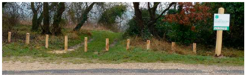
Fermeture des parkings sauvages Rd 100