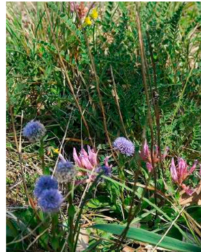
Astragale de Montpellier et Globulaire

tion des pitons rendant les autres solutions envisagées impraticables. Ces travaux sont effectués en respect de la zone de quiétude, en place du 1 er mars au 30 juin afin de permettre au faucon pèlerin migrateur partiel de venir se reproduire dans les falaises à partir de fin février.