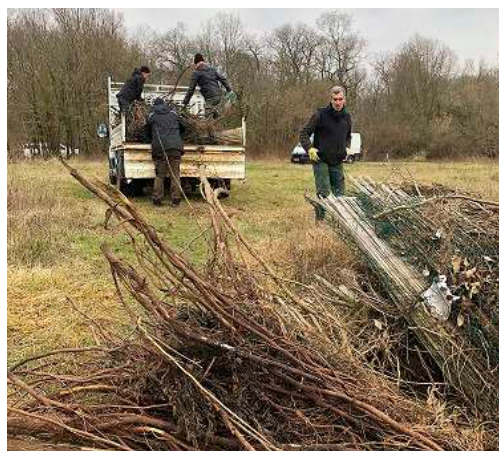
Évacuation des déchets Rd 100