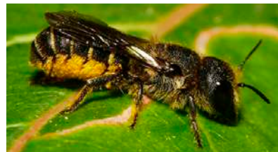
Heriades rubicola - Ne mesure que 5 à 6 mm.