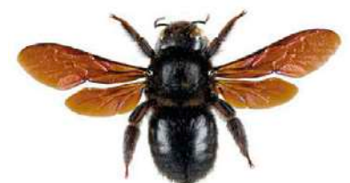
Abeille charpentière Creuse elle-même son nid dans le bois. Mesurant plus de 2 cm, il s'agit de l'une des espèces les plus grandes.