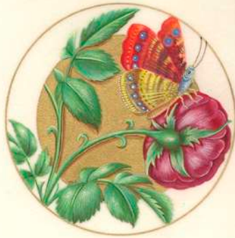
Marchand Lapointe : Rose et Papillon d'après Anne de Bretagne

1 - Créations - Tissages - 10 rue de l'Eglise - 06 07 55 25 46