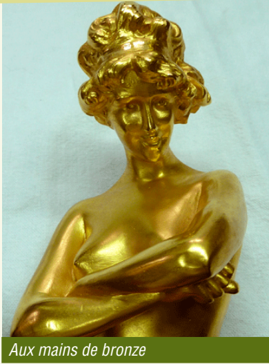
Aux mains de bronze