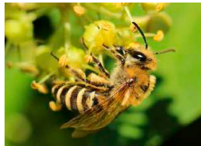
Collete du Lierre - Ne butine que cette plante. Son cycle de vie est calqué sur la floraison du lierre en octobre et les adultes ne volent qu'à cette période.