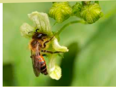
Andrène de la Bryone Ne butine que la Bryone.