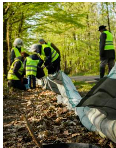
Mise en place d'un crapaudrome

■ Sur leur succès reproducteur : l'éclairage