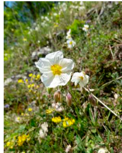
Hélianthème des Apennins