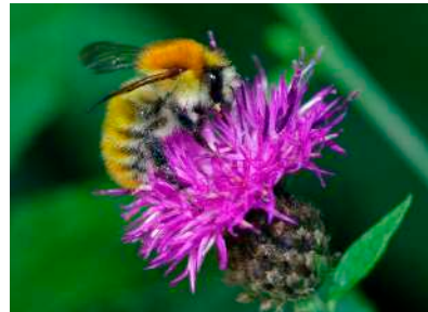
Bourdon des champs Vole du printemps à l'automne.