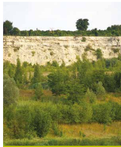
Front de taille

En raison de sa fragilité et de la dangerosité de la falaise, l'accès à la réserve est réglementé : on peut la découvrir lors de sorties organisées par la ville de Limay ou le Parc. D'autres circuits-découverte sont