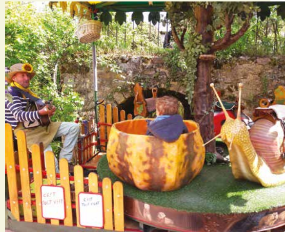
Le manège à pétales de Monsieur Raifort