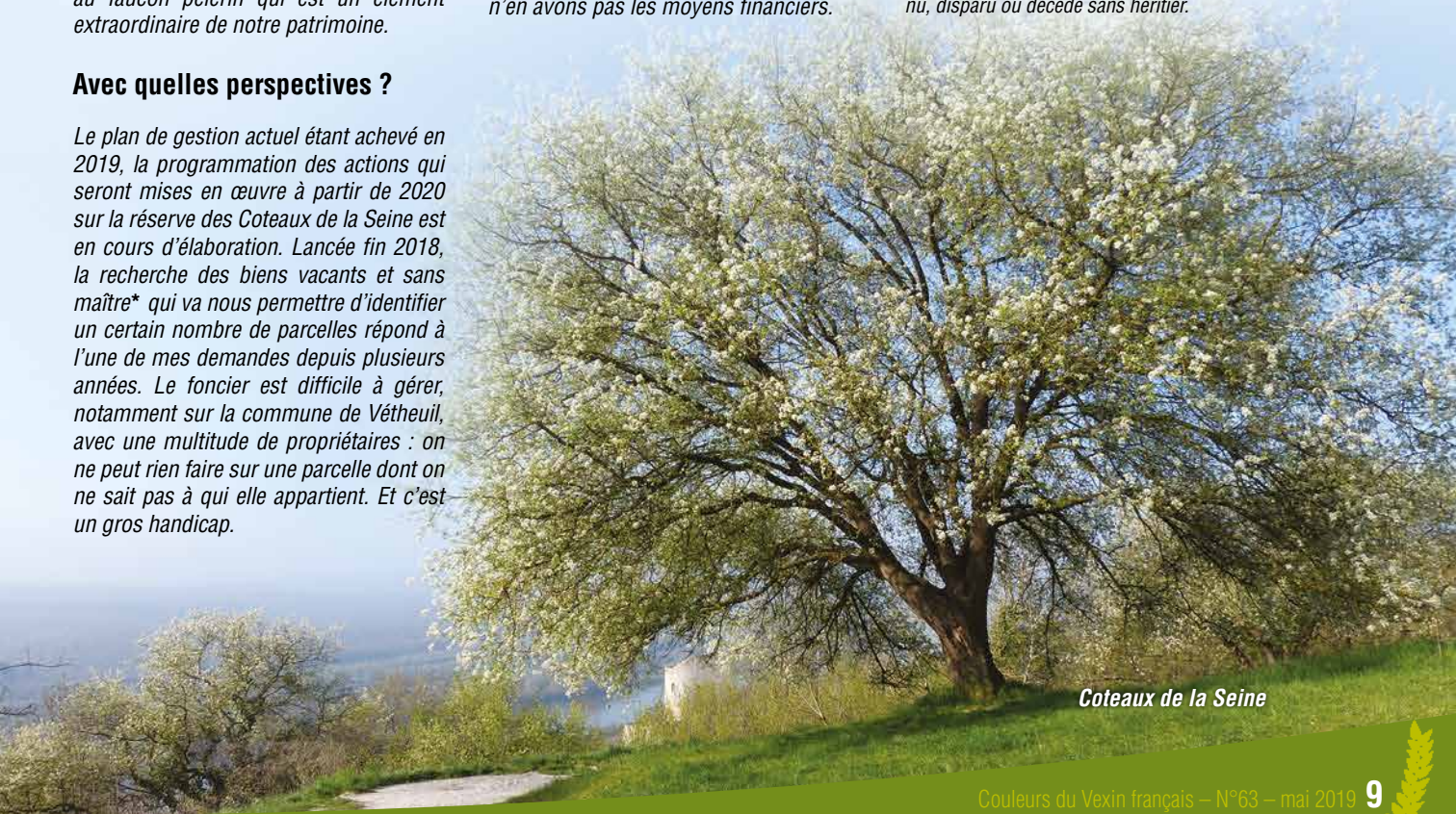
Coteaux de la Seine

* Le vocable « biens vacants et sans maître » désigne les biens dont le propriétaire est inconnu, disparu ou décédé sans héritier.