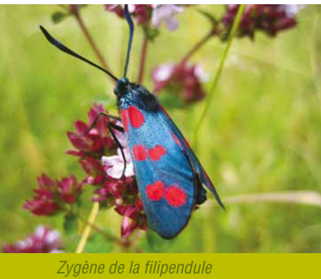
Zygène de la filipendule

Située le long de l'Aubette de Meulan, le site de la réserve naturelle régionale de Vigny-Longuesse est celui d'une ancienne carrière de pierre calcaire, exploitée artisanalement tout au long du XX ème siècle. On retrouve ainsi ce qu'on appelle « la pierre de Vigny » dans de nombreuses constructions vexinoises, dans le soubassement de l'église du village... « Et même jusque dans les matériaux qui ont servi à bâtir la chapelle d'Erettat », affirme Grégory Jéchoux, chargé