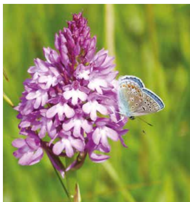
Orchis pyramidal et Azuré commun

Ceux que les espaces naturels et leur habitants ravissent ou que la formation de notre planète font rêver n'ont que l'embaras du choix, dans le Vexin français, avec ses trois réserves naturelles. Rapide tour d'horizon.