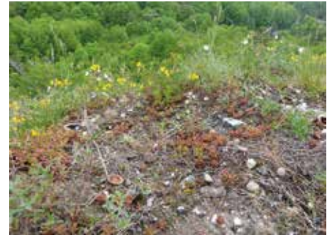
Pelouses rupicoles calcaires

Impression : Destbouis Grésil - Conception : D. Balcic - Juin 2021