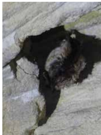
Murin à oreilles échancrées