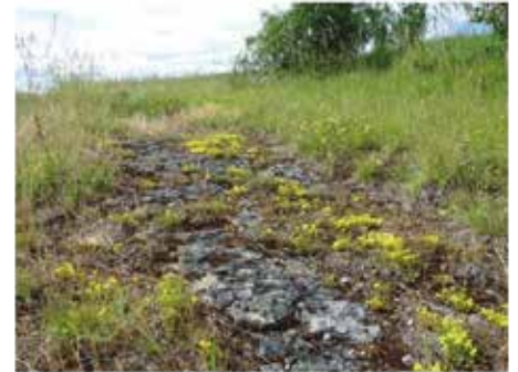
Pelouses rupicoles calcaires

On les trouve par exemple sur les pitons crayeux de la Réserve naturelle nationale des Coteaux de la Seine, ou encore au niveau de quelques pelouses de la Sablonnière, localisées sur la commune de Saint-Martin-la-Garenne. Cet habitat est aussi recensé sur les communes de Montreuil-sur-Epte et Omerville, sur le site Natura 2000 « Vallée de l'Epte francilienne et ses affluents ».