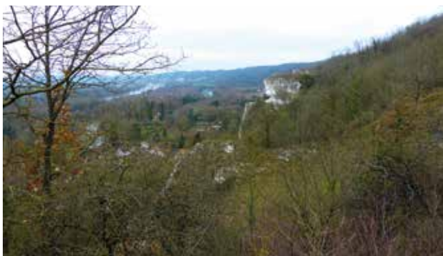
Travaux de réouverture du piton du Cul du Chat à Haute-Isle (avant travaux)

• Avril-Mai 2021 : afin de protéger définitivement les populations de chiroptères qui y séjournent, la cavité de Follainville-Dennemont a été fermée ce printemps ! En effet, de nombreuses effractions avaient été constatées par l'équipe du Parc ces dernières années. Cela mettant en péril la colonie de Grands murins qui y mettent bas durant l'été, ainsi que celles qui y hibernent, il a été décidé de recourir à une méthode de sécurisation plus solide que la précédente. L'entreprise Maison Bourrelier a réalisé les travaux au début du mois de mai, avant que les chauves-souris n'investissent les lieux. Avant cela, près de 130 m 3 de déchets divers et variés ont été évacués par l'entreprise Poulain Vivien, nettoyant la cavité de fond en comble.