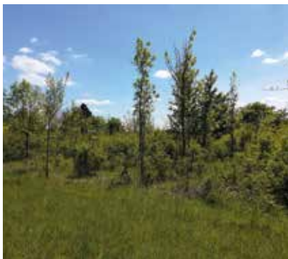
Travaux de débroussaillage de la pelouse sèche à Chars (avant travaux)