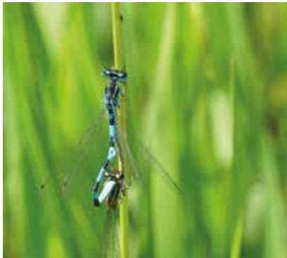
Cœur copulateur d'Agrion de Mercure