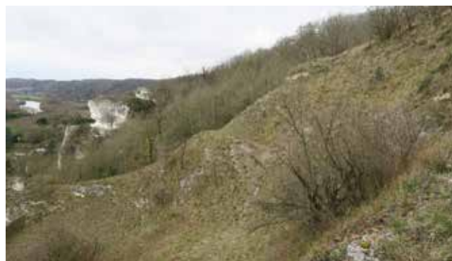
Travaux de réouverture du piton du Cul du Chat à Haute-Isle (après travaux)