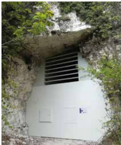
Travaux de fermeture de Follainville-Dennemont

Si vous êtes exploitant agricole, sachez qu'il est possible de mettre en œuvre des MAEC sur vos parcelles déclarées à la PAC !