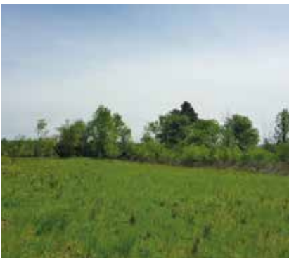
Travaux de débroussaillage de la pelouse sèche à Chars (après travaux)