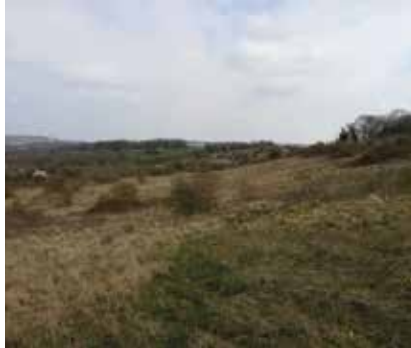
Site de Vaulézard à Vienne-en-Arthies