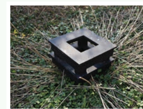
Cabinet de curiosités

Duo de danse et voix, au sein de l'installation "Le Jardin dans les Champs" réalisée avec les participants de Us.