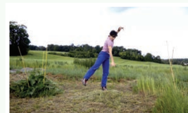
Duo des Herbes Folles

Duo de danse et voix, au sein de l'installation "Le Jardin dans les Champs" réalisée avec les participants de Us.