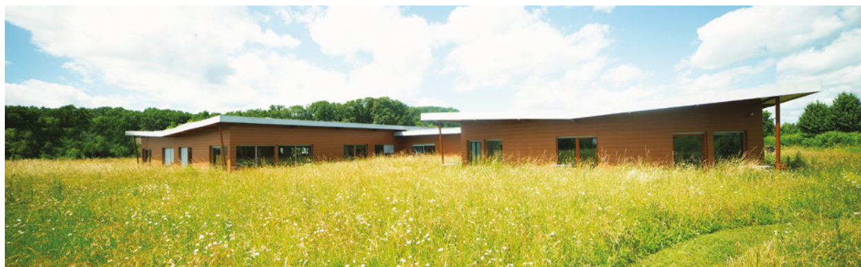
Hervé Thermique, une entreprise d'Ennery spécialiste en Génie Climatique et Génie Electrique avait besoin de pourvoir un poste d'assistante méthode, c'est chose faite grâce à la Mission Locale AVEC de Cergy-Pontoise.