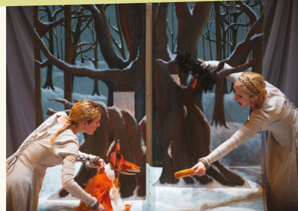
Le Roman de Renart

Le Vexin suscite depuis plusieurs années l'intérêt du Théâtre de l'Usine, qui met en œuvre des partenariats avec des communes pour, d'une part, y faciliter la présentation de spectacles et, d'autre part, encourager la venue des habitants à Eragny, en proposant notamment des tarifs