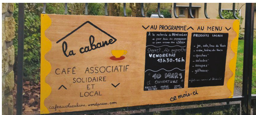
La Cabane, véritable lieu de vie avec des ateliers, des concerts, des expositions ou toute autre activité proposée par les bénévoles qui souhaitent échanger et transmettre leurs savoir-faire.

Dans un café, on boit du café, ou autre chose. Quand il est associatif, on y échange, on fait du yoga, du bricolage, du théâtre... C'est ce que propose La Cabane.