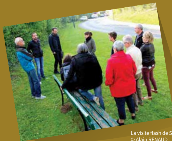
La visite flash de Santeuil

Accompagnées par le Parc naturel régional du Vexin français, les communes de Chars, Neuilly-en-Vexin, Sagy, Santeuil et Us ont choisi d'élaborer conjointement leur Plan Local d'Urbanisme et, dans ce cadre, de porter une attention particulière à leur patrimoine. Pour sensibiliser habitants et élus aux enjeux de développement territorial et de qualité de vie portés par les patrimoines locaux, le Parc, via son label Pays d'art et d'histoire, a organisé dans chaque commune une visite flash. Flash car rapide dans le but d'être attrayante (moins d'une heure de visite) ; flash car ciblée sur une thématique spécifique démontrant le lien entre patrimoine et urbanisme, passé et futur, histoire et projets ; flash car informelle et donc propice aux échanges entre les participants et les intervenants du Parc.