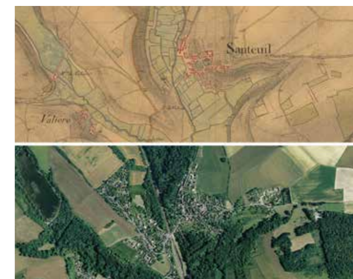
Evolution urbaine de Santeuil : carte d'Etat-Major des années 1830 et photo aérienne actuelle

En fait, la colline de la Gève sur laquelle se trouve le lieu-dit des Epagnes était un site stratégique. Se dressant entre deux cours d'eau (la Viosne et son affluent, le ru de Vallière), on pouvait aisément, depuis cette éminence naturelle, en défendre et contrôler le passage. La Tour de Viosne, structure défensive médiévale notamment indiquée sur le plan d'intendance et le cadastre dit napoléonien, était d'ailleurs située juste en contrebas de la colline, près du gué emprunté par la chaussée de Brunehaut. Peut-être que le déclin de cet axe de circulation, autrefois incontournable, a joué un rôle dans l'abandon du site des Epagnes. De même, l'instabilité et l'insécurité du Vexin français durant la période médiévale ont pu inciter les populations à se regrouper en centre-bourg. Finalement, l'archéologie ne nous donne aucune certitude mais de passionnantes hypothèses et surtout un constat : celui d'une extension récente du village qui a redonné à Santeuil son organisation urbaine ancienne, de part et d'autre de la Viosne.