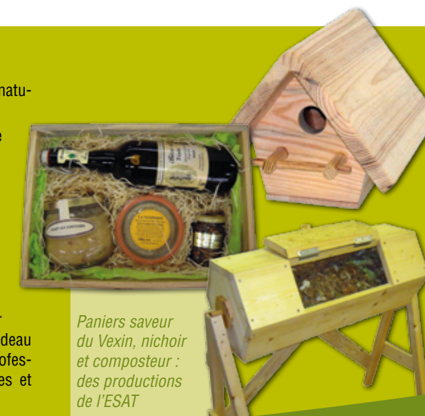
Paniers saveur du Vexin, nichoir et composteur : des productions de l'ESAT

Alors avec les fêtes de fin d'année qui approchent, l'ESAT la Hêtraie se fera un plaisir de faire plaisir car un panier saveur du Vexin est un cadeau original qui participe à l'insertion professionnelle des personnes handicapées et contribue à une agriculture durable.