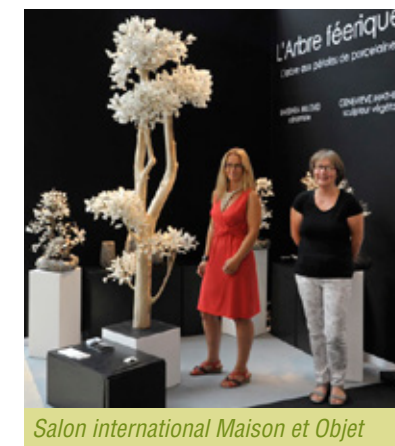
Salon international Maison et Objet

reste aussi d'actualité. C'est dans le même esprit qu'ont été organisés sur 2013-2014 les Eco-défis, destinés à encourager les artisans, commerçants et prestataires touristiques et de loisirs du Parc à s'engager et à mener des actions concrètes en matière de développement durable. Une nouvelle édition des Eco-défis, lancée le 9 novembre à la Maison du Parc , est étendue à toutes les entreprises du Parc. Le projet Responsabilité Sociétale des Entreprises (RSE) qui comprend une dimension environnementale contribue à apporter pour sa part une réponse à l'enjeu de la transition.