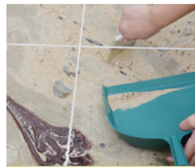
Deviens paléontologue !

Le programme 2016 comporte trois temps forts. Des animations organisées en mars – avril à l'attention des scolaires et du grand public dans le cadre de « Fréquence Grenouille », opération de sensibilisation à la préservation des zones humides. Viendra ensuite la Fête de la Nature en mai. Troisième rendez-vous, enfin, la Fête de la science édition 2016.