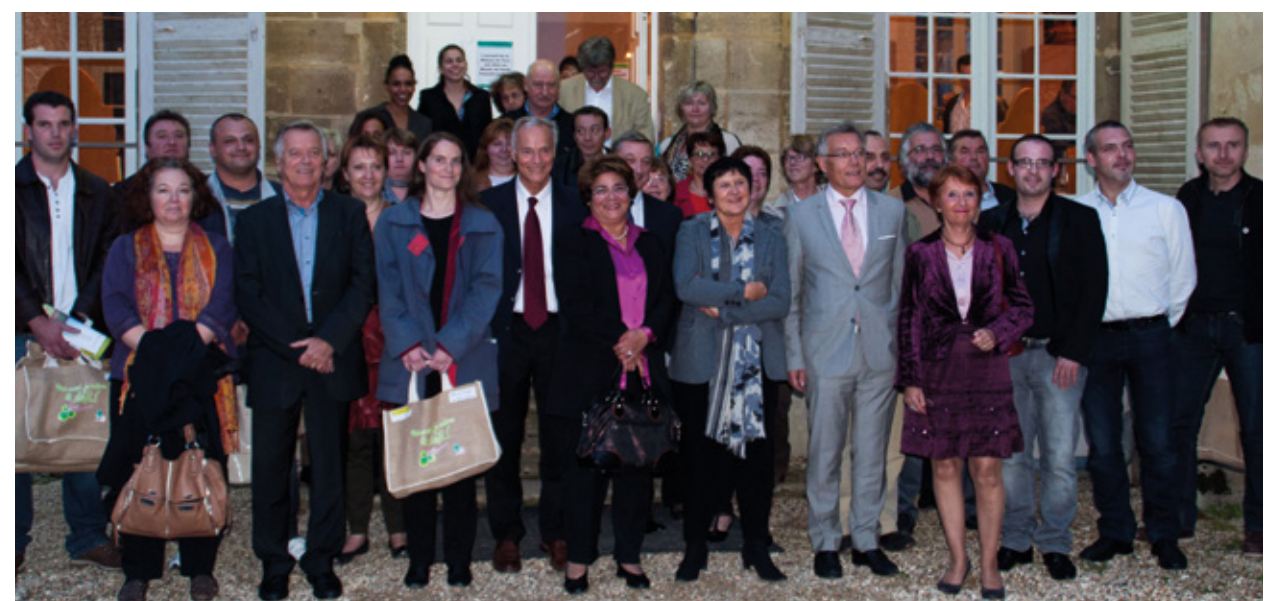
Remise des Eco-défis à la Maison du Parc en 2013

La seconde édition des Eco-défis a été lancée le 9 novembre 2015. Ceux-ci ne s'adressent plus aux seuls artisans et commerçants mais à l'ensemble des entreprises et des prestataires touristiques et de loisirs du territoire. Les candidats doivent se manifester avant le 31 décembre 2015 pour pouvoir bénéficier d'un pré-diagnostic gratuit et d'un accompagnement dans la réalisation de leurs défis.