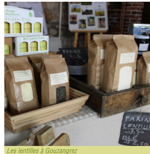
Les lentilles à Gouzangrez

La famille des « Produits du Parc » s'agrandit avec le marquage des lentilles et de la farine de lentilles produites par la Ferme de la Distillerie. Vertes ou blondes, riches en protéines, les lentilles sont cultivées sans traitement à Gouzangrez. Vous pouvez vous les procurer à la ferme le premier mercredi du mois de 17h à 19h (ou sur rendez-vous).