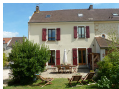
Les Volets Rouges