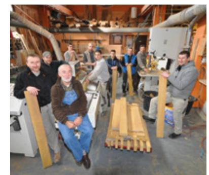
Toute l'équipe de la menuiserie Saint-Antoine d'Ennery a relevé le défi