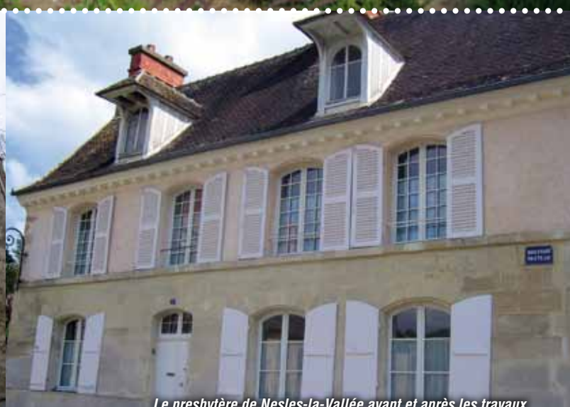
Le presbytère de Nesles-la-Vallée avant et après les travaux