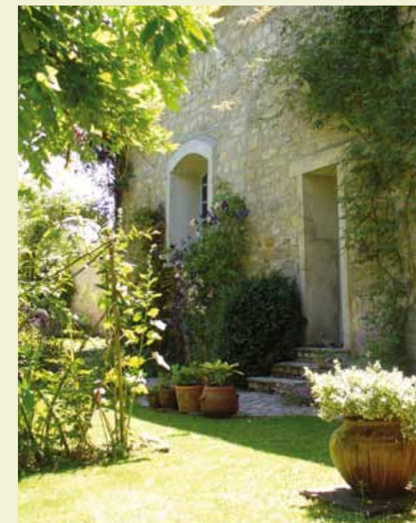
Gîte rural de Léry à Auvers-sur-Oise