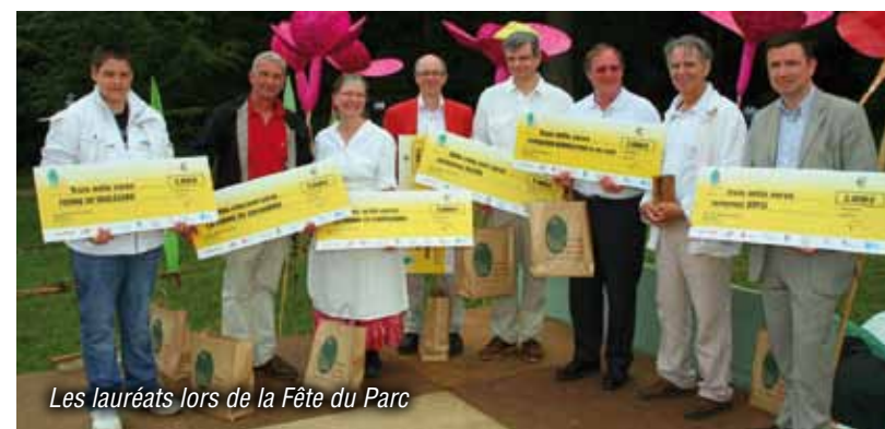
Les lauréats lors de la Fête du Parc

la Fédération des Parcs, les Chambres de Métiers et de l'Artisanat du Val d'Oise et des Yvelines, la Chambre de Commerce et d'Industrie Versailles Val d'Oise - Yvelines, la Chambre interdépartementale d'Agriculture d'Ile-de-France, l'ARENE (Agence Régionale de l'Environnement et des Nouvelles Energies), l'Agence de l'Eau Seine Normandie.