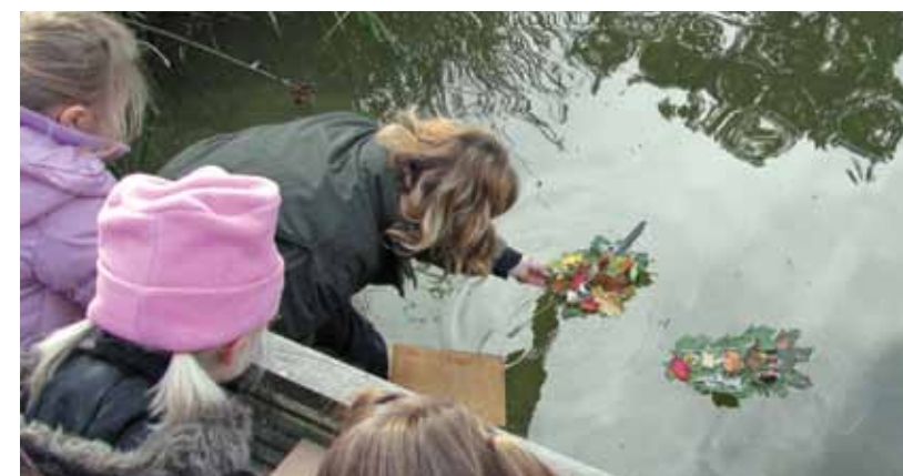
Des radeaux nature fabriqués lors des ateliers proposés par le musée du Vexin français