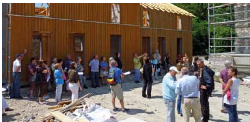
Découverte d'un chantier à Follainville-Dennemont

adapté ainsi qu'aux demandes des jeunes désireux de quitter le domicile parental. Pourquoi construire du neuf si l'on peut réhabiliter l'ancien ? Surtout si cette réhabilitation peut se faire avec le plus grand souci d'efficacité énergétique, aux normes BBC (bâtiment basse consommation). C'est dans cet esprit que le Parc a lancé en 2008 un appel à projets à l'attention des bailleurs sociaux, lequel a permis de sélectionner quatre projets dans le Val-d'Oise et deux dans les Yvelines dont une opération située à Follainville-Dennemont, commune dynamique sur ce thème du logement social.