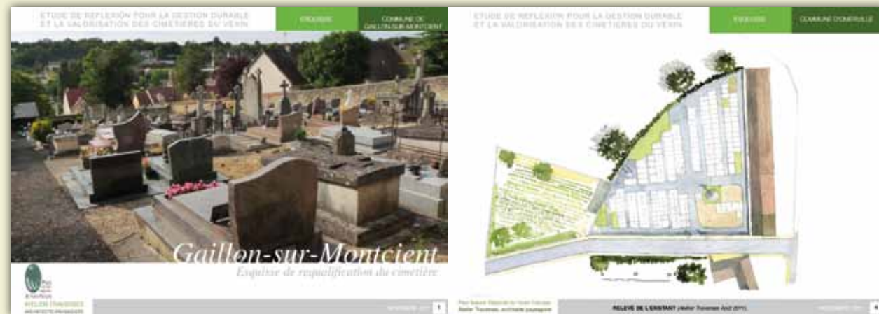
Cimetière de Gaillon-sur-Montcient et cimetière d'Omerville

Sonia Gros Chargée de mission Aménagement et Paysage Tél : 01 34 48 65 81