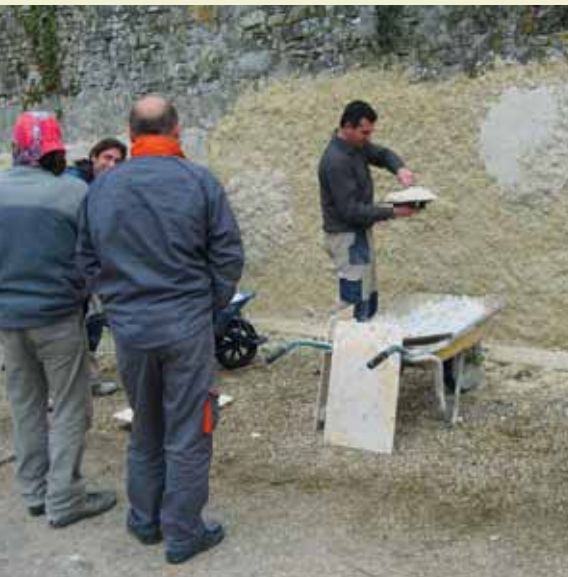
Formation « mise en oeuvre d'un enduit chaux-chanvre »

Les professionnels concernés par les questions d'environnement ne se trouvent pas seulement du côté des activités touristiques ou de loisirs : les acteurs du