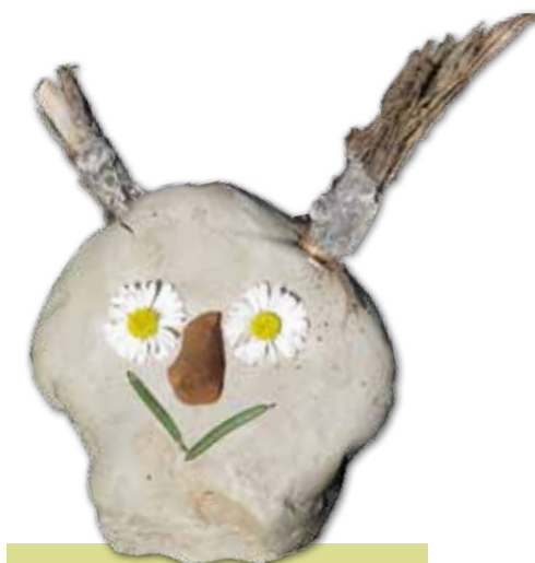
Atelier Art et nature

voir un professeur d'archéologie s'exprimer sur le néolithique en Val de Seine, thème de l'exposition qui se tient jusqu'au 1 er juillet au musée du Vexin français. C'est le même esprit qui anime les ateliers familles, organisés pendant les vacances scolaires. Après le thème de l'eau et celui