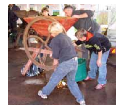
Du jus de pommes pressé sur place

tion était ainsi l'occasion de fêter les 10 ans du premier verger planté en partenariat avec le Parc.